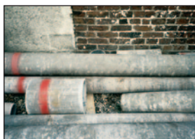
Canalisation en amiante ciment

Vous devez fournir un repérage des matériaux et produits de la liste A et de la liste B contenant de l'amiante par un opérateur de repérage. Si le repérage des matériaux et produits de la liste A et de la liste B a été effectué avant le 1 er janvier 2013, vous devez faire réaliser le repérage complémentaire des éléments de la liste B qui ne figuraient pas dans l'ancienne liste au plus tard dans les neuf ans à compter de la date d'entrée en vigueur du décret du 3 juin 2011, soit avant le 1 er février 2021.