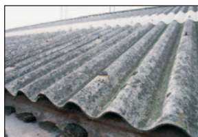
Toiture en amiante ciment