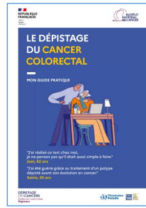
Livret d'information générique